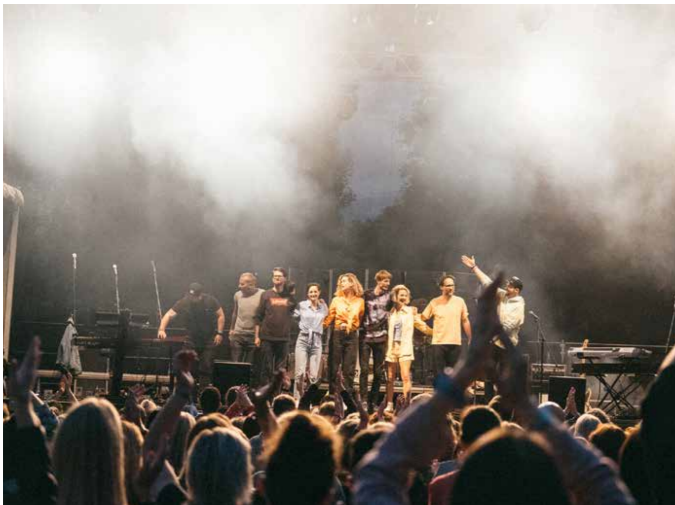
Smetanova Litomyšl, festivalové zahrady, foto: Tereza Slowiková