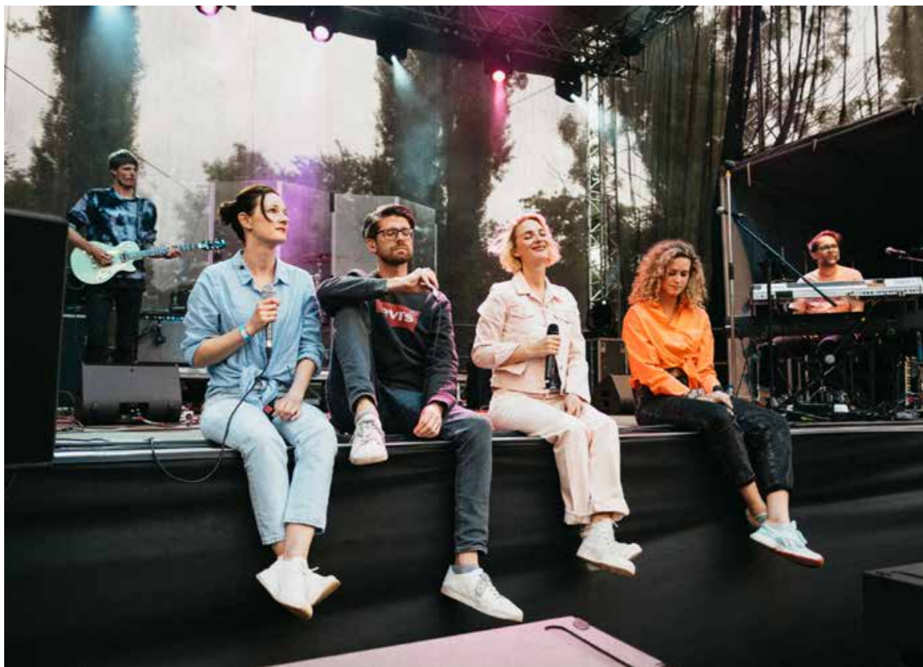
Ledárny Open Air